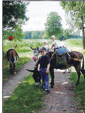
Freude in und mit der Natur